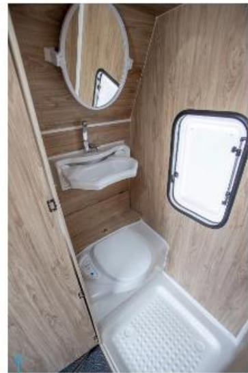
Utställbart handfat i hygienutrymmet.

Vidare har det tillkommit förnyade motor från Svenska Tält, instegspall av stadig konstruktion, pulverbackare, gasstov, trerätts med dubbel-funktion, extra 230 uttag för extra uttag för USB.