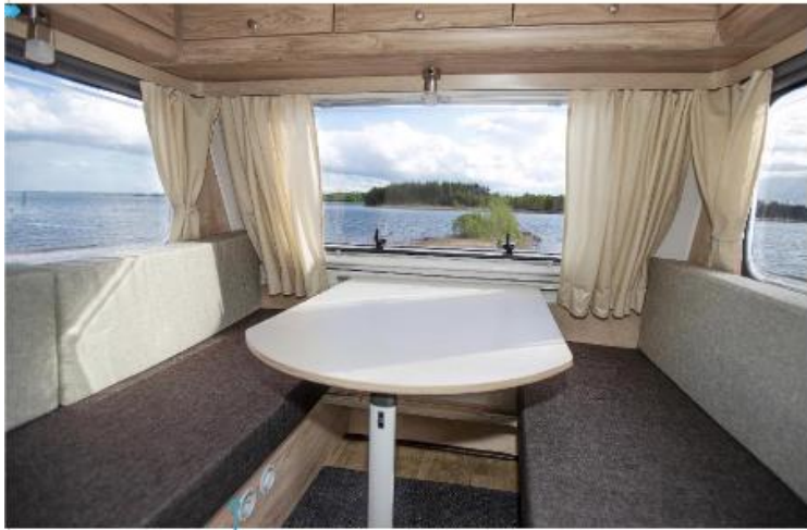
Dubbel funktion - sittgrupp på dagen och säng på kvällen.

DET SÅGS ATT STORLEKEN inte har någon betydelse. Men det har den. I alla fall när det gäller husvagnar i kombination med ytterst små dragbilar. Med en totalvikt på bara trekvarvs ton kan till och med personbilar som en Mini Cooper eller en Fiat 500 kopplas Fritidsvagnen på kroken.