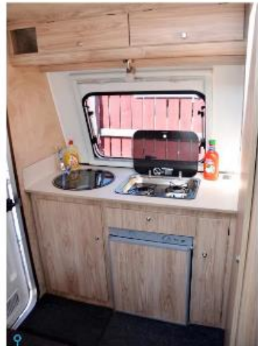
Funktionell köksavdelning allra längst bak vid entrén.