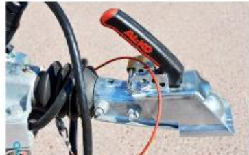
Kod, det är AL-KO som gäller.