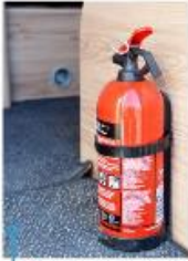
Brandsläckare vid entrén.

Sedan ska man ju också lägga till att Fritidsvagnen är väldigt smidig när på buken. Det enkla N-modellen kostar bara 129 000 kronor och NTL (som vi kallar på, med mallen) endast 20 000 kronor ytterligare.