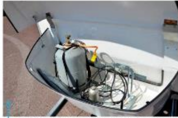
Rymlig gasolkastrer med tanke på vagnens ringa storlek.

Att en hel del campare ser Fritidsvagnen som en tår i havsgastappning är ingen dum jämförelse. Samtidigt behövs det inte på långa vägar veta så negativt som det låter, utan tvärtom!